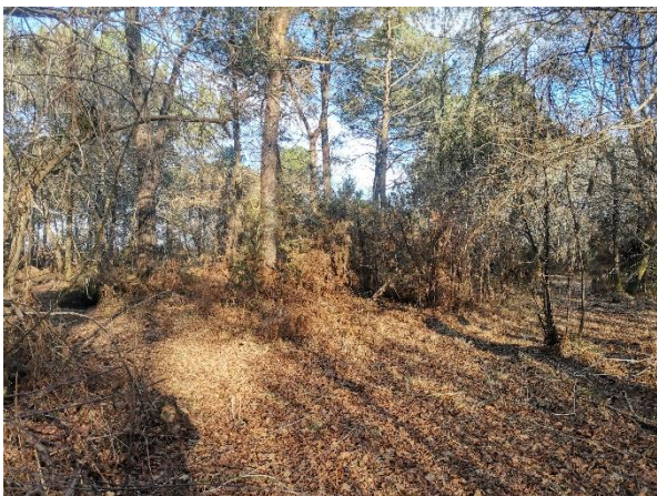
Photographies du terrain. Janvier 2024, QGIS, Cpie Seignanx Adour